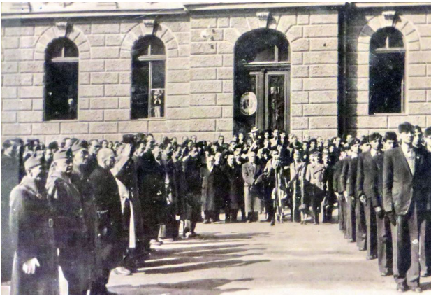
A főgimnázium udvara