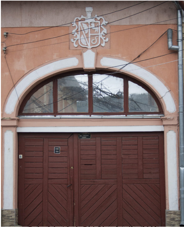
Balta ház / fotó: Riti József Attila (2013)